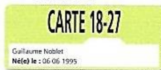
Doc 2 • Extrait de la carte de réduction de Guillaume

La Ligne Grande Vitesse Paris-Marseille a une longueur de 750 km.